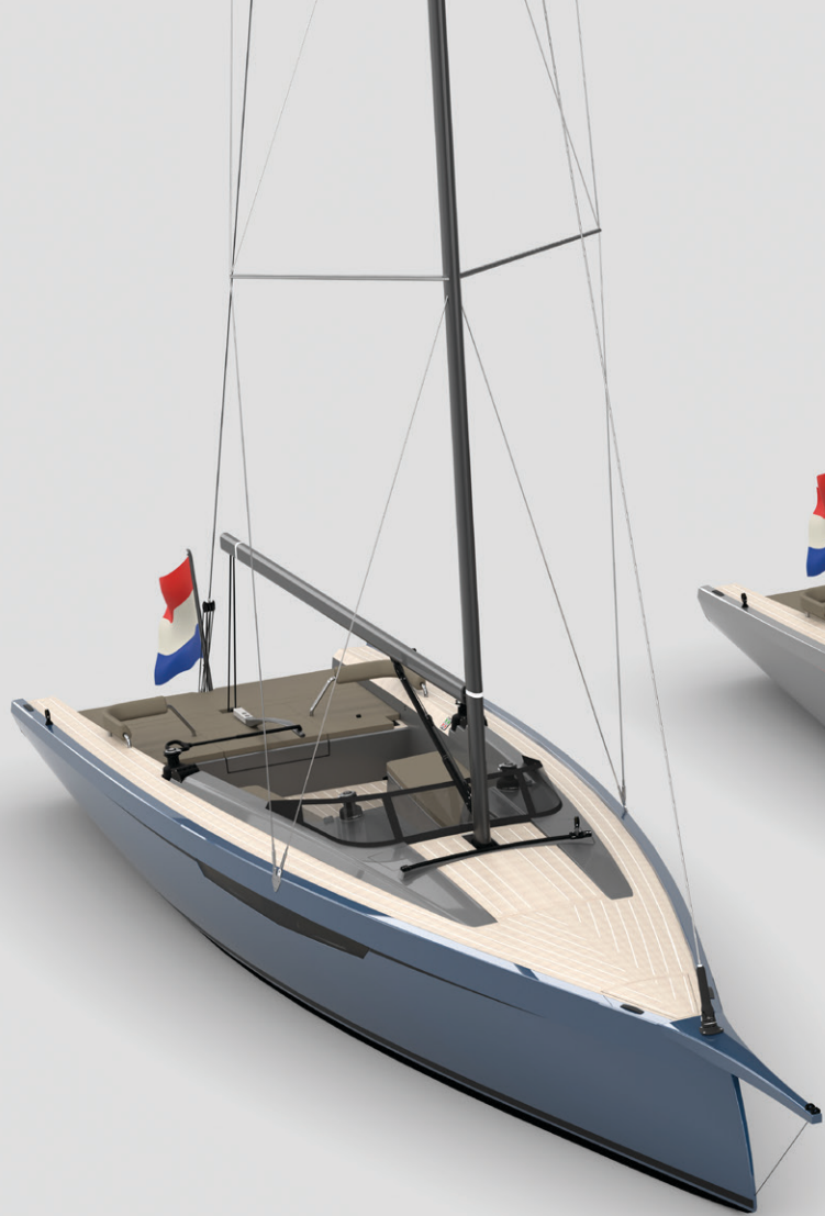
Fordeck with Esthec