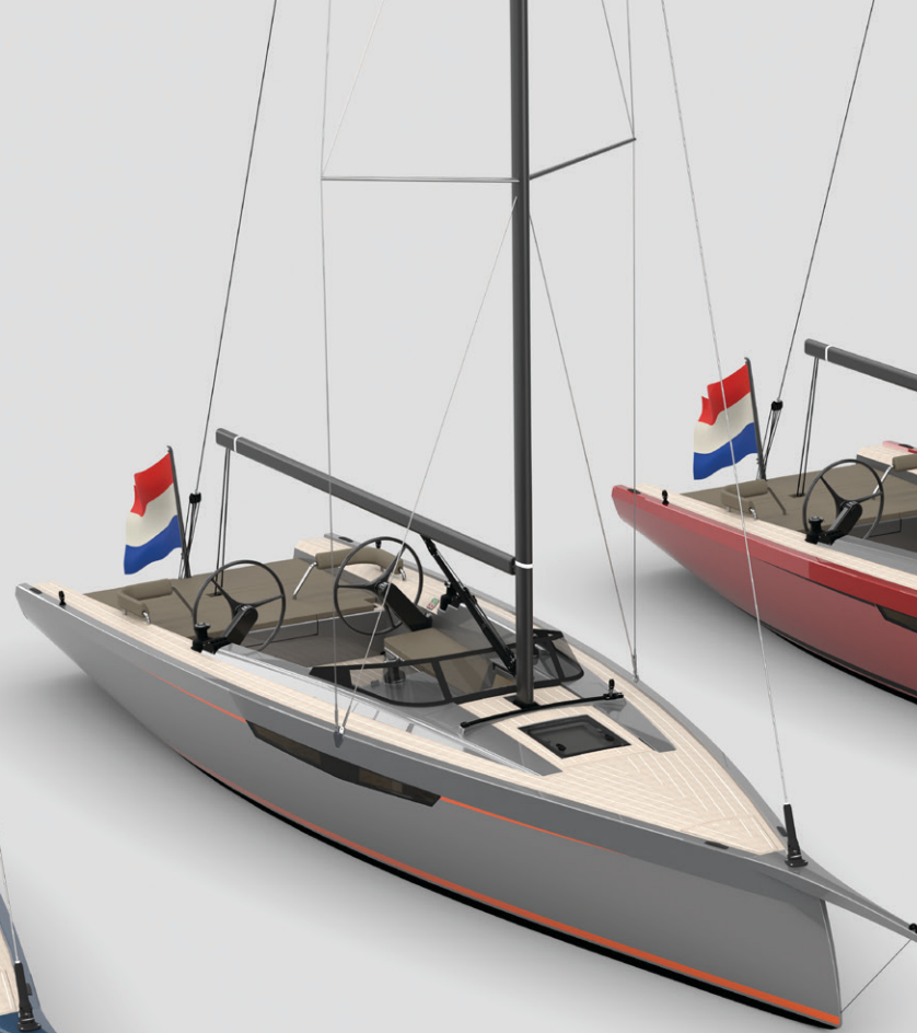
Fordeck with deck hatch