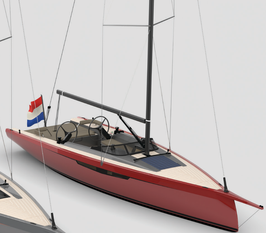
Fordeck with solar panel